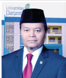
Dr. K.H. Hidayat Nurwahid, MA